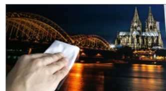
アルコールで拭ける