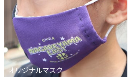
オリジナルマスク