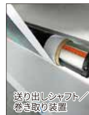
送り出しシャフト/ 巻き取り装置